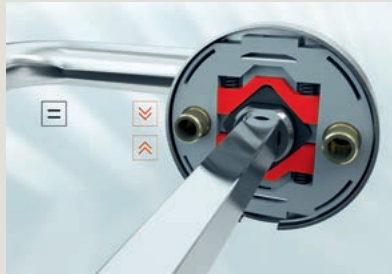
01 Ruhestellung im Normalzustand

Für die mühelose Bestellung, Lagerung und Montage